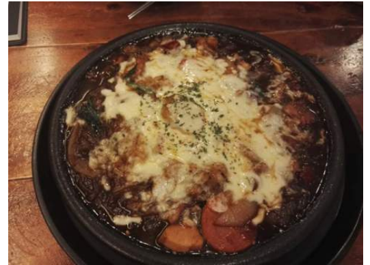
Insgesamt mein koreanisches Lieblingsessen: Jjimdak

Die koreanischen Studenten registrieren ihre Kurse meist nur wenige Minuten oder Stunden nachdem das System geöffnet ist, deswegen würde ich euch ebenfalls empfehlen eure Kurse schnell online auszuwählen, da die Plätze oftmals begrenzt sind. Ich wusste am Anfang noch nicht, wie es genau abläuft und bin deshalb nicht in jedem Kurs von Anfang an registriert worden. Trotzdem bin ich aber im Endeffekt in alle Kurse reingekommen, da man sich als Exchange Student alternativ auch einfach in die erste Vorlesung reinsetzen und den Professor danach bitten kann, einen selber online noch einmal im Nachhinein zu registrieren. Bei mir hat dann noch alles geklappt, trotzdem ist es aber einfacher und entspannter, wenn ihr wisst, dass ihr in allen benötigten Kursen sicher registriert seid.