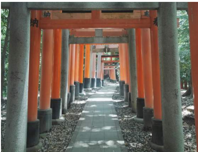
Typische Shrine-Architektur für einen Tempel in Kyoto