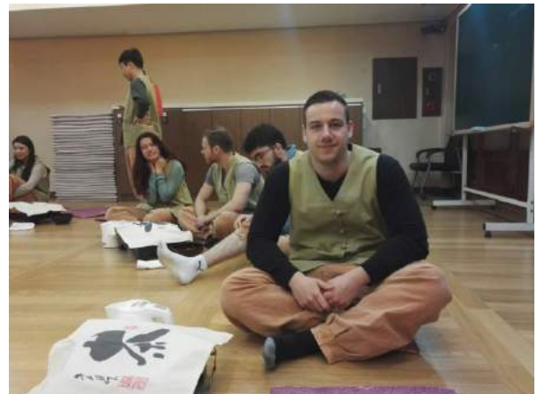
Ich mit anderen Austauschstudenten beim Templestay in Seoul

An der Inha University gibt es ein sogenanntes ISL-Team (International Student Lounge), was euch bei allen möglichen Problemen und Fragen als Austauschstudent zur Seite steht. Dies besteht aus koreanischen Studenten, die verschiedenste Events organisieren und sogar Sprachkurse möglich machen. Ihr werdet von ISL per Mail jeden Monat über mögliche Field Trips organisiert und diese Chance, dort mitzumachen sollte man auf jeden Fall nutzen. Bei uns gab es z.B. einen Temple Stay (Besuch eines Tempels und lernen wie ein buddhistischer Mönch zu leben), einen Trip in dem wir ein Baseballspiel anschauten oder auch den Besuch der Kia Motors Factory. Zusätzlich hat ISL eine eigene Lounge in der ihr sitzen, euch etwas unterhalten oder eure Fragen den Mitarbeitern stellen könnt.