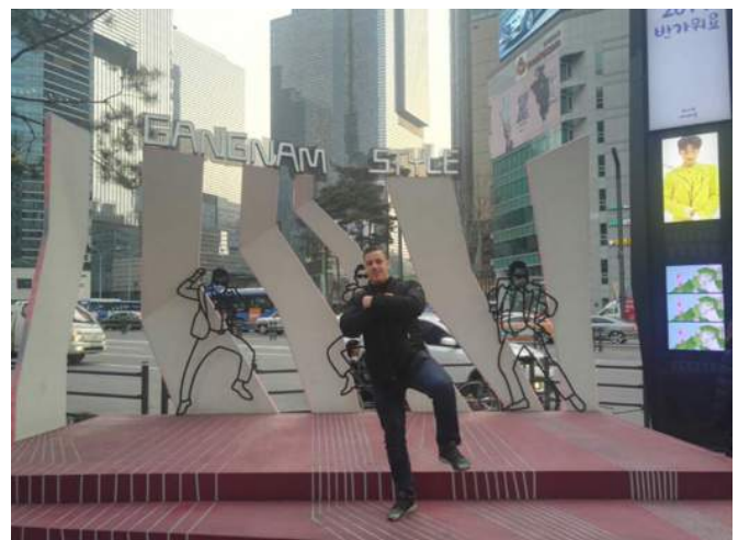
Dieser Spot in Gangnam ist berühmt, weil er auch im bekannten Gangnam-Style Video von Psy vorkommt

Ich fange einfach mal mit Seoul an: Seoul ist nur etwas weiter als eine Stunde von Incheon entfernt und deshalb war ich so gut wie jedes Wochenende in Seoul. Das witzige bei meinem Auslandssemester war, dass ich die wirklichen Attraktionen von Seoul (wie z.B. den großen Regierungspalast oder die traditionellen Hanok Villages) erst in meiner letzten Woche vor Abreise gesehen habe. Das lag daran, dass ich vorher immer nur dort war um Leute zu treffen, zu essen oder auszugehen. Vor allem zum ausgehen ist Seoul sehr zu empfehlen, da es super viele Möglichkeiten gibt. Im Viertel Itaewon werdet ihr auf viele Ausländer treffen und alles wirkt recht westlich. Hier sprechen die meisten Leute auch gut Englisch. Das liegt unter anderem daran, dass die US-Military in Itaewon stationiert ist und sich deshalb seit Jahrzehnten die Amerikaner dort aufhalten. Auch für einen Tagestrip ist Itaewon definitiv eine Reise wert. Zwei weitere Viertel die erwähnenswert sind und in die ihr definitiv sehen werdet, sind Gangnam und Hongdae. Gangnam (sicherlich bekannt aus Gangnam Style) ist der reichste Distrikt von Seoul, der sehr westlich, aber auch viel sauberer als z.B. Incheon oder die anderen Viertel ist. Hier befinden sich alle möglichen internationalen Läden. Es ist zwar alles etwas teurer hier, aber definitiv auch eine Reise wert.