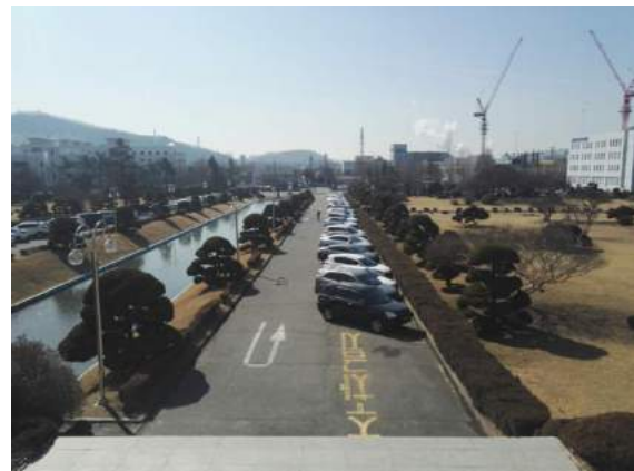
Campus der Inha University

Ich habe eine sogenannte Off-Campus-Unterkunft gewählt. Das heißt im Grunde genommen nichts Anderes als, dass die Inha University für euch bestimmte Studio Apartments organisiert. Wenn Ihr am Flughafen ankommt, bringt euch ein Bus zur Inha University und hält ebenfalls an dem Ort der Off-Campus-Apartments. Hier sollte euch dann ein anderer Student treffen, der euch in die Unterkunft reinlässt und mit dem Vermieter zusammen eine Schlüsselübergabe macht.