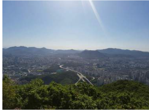
Der Blick vom Bukchon Hanok Village aus über die Skyline von Seoul

Mein Lieblingsviertel von Seoul ist Hongdae, da hier die meisten jüngeren Koreaner ausgehen. Es ist vor allem abends sehr voll und eng, aber die Lautstärke und die Atmosphäre allgemein sind atemberaubend.