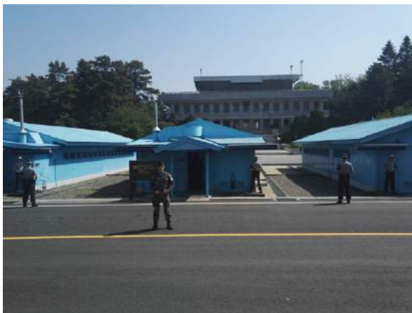
Blick von der südkoreanischen Seite der Grenze auf das nordkoreanische Verwaltungsgebäude (im Hintergrund). In den blauen Gebäuden finden Treffen zwischen Nord- und Südkorea statt

Eine Reise zur DMZ (Demilitarized Zone), der Grenze zwischen Nord- und Südkorea sollte man meiner Meinung nach auch gemacht haben. Es kostet zwar ca. 90€ (da alle Touren über das US Military organisiert werden), jedoch sieht man den berühmten Ort mit den blauen Häusern an dem sich südkoreanische und nordkoreanische Soldaten gegenüberstehen. Man lernt zusätzlich noch einige Dinge über den Koreakrieg und über die Zone an sich. In der Tour geht man ebenfalls zum Dora Observatory, eine Aussichtsplattform die einem einen Blick in Nordkorea hinein erlaubt. Interessant war es vor allem, dass man hier nordkoreanische Propagandamusik hören konnte, da die Nordkoreaner Ihre Lautsprecher mit Absicht so positionieren, dass man sie auf der Plattform hören kann.