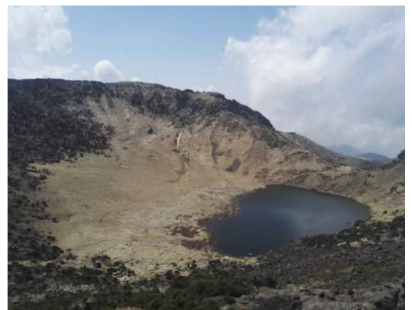
Auf dem Gipfel des höchsten Berges in Korea (Hallasan Mountain in Jeju); der Berg ist eigentlich ein Vulkan

Wenn man ein Auslandssemester in Südkorea macht, muss man auf jeden Fall auch auf die Jeju-Insel reisen. Die Jeju-Insel ist eine Insel, die sich unter dem südkoreanischen Festland befindet und schon subtropisches Klima hat. Sie bietet eine wunderschöne Natur und aus diesem Grund kommen die Koreaner auch z.B. hierher um zu heiraten. Wir haben uns für unseren Trip einen Mietwagen geholt, um alle Ecken der Insel zu sehen. Wer hiken gerne mag, dem kann ich absolut nur empfehlen den Hallasan Mountain, den größten Berg Koreas hochzuwandern und dabei den schwierigsten Trail zu nehmen. Es ist definitiv eine Herausforderung, aber der Blick von oben ist es total wert.