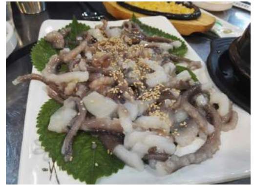
Für Abenteuerlustige: Der sogenannte "Alive Octopus" (die Stücke bewegen sich noch wenn er auf dem Teller liegt)

Generell kann man sagen, dass das Leben am Campus in Korea echt Spaß macht. Der Campus an der Inha University ist echt super und gut gepflegt. Es gibt auch einen großen See, an dem man gerade im Sommer sehr gut sitzen kann und sich mit anderen treffen kann. Aus den Vorlesungen an sich nimmt man zwar nicht soviel mit wie in Deutschland (was einen das ein oder andere Mal auch die Qualität der DHBW wertschätzen lässt), aber das Leben nach den Vorlesungen macht wirklich Spaß weil es so viele Möglichkeiten gibt. So gut wie jeden Tag habe ich mich mit einem meiner besten koreanischen Freunde getroffen und er hat mir jedes Mal ein neues Restaurant am Backgate (Hintereingang der Uni & Bereich in dem sich die meisten Restaurants und Bars befinden) gezeigt. Erst nach ca. zwei bis drei Monaten gingen wir dann in etwa immer in die gleichen Restaurants. Dazu muss ich auch sagen, dass das koreanische Essen wirklich super lecker ist. Ich würde euch empfehlen alles auszuprobieren. Außerdem, gibt es einige Bars in der Nähe vom Campus in die man unter der Woche gut gehen kann oder eben, wenn man mal nicht nach Seoul gehen möchte.