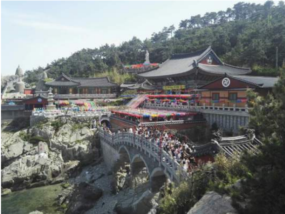
Der wunderschöne Haedong-Yonggung Tempel in Busan

Neben der Jeju-Insel ist die Stadt Busan definitiv eine Reise Wert. Busan bietet einen sehr schönen Tempel, der am Wasser gelegen ist sowie diverse traumhafte Strände. Es wirkt einfach insgesamt sehr viel ruhiger und nicht so hektisch und städtisch wie in Seoul, wo wirklich überall Hochhäuser sind.