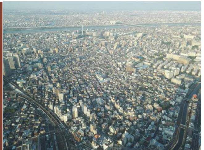
Atemberaubend: Der Blick vom Tokyo Skytree aus (zweithöchstes Bauwerk der Welt)