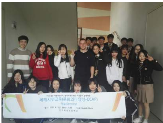
Gruppenfoto mit einer Klasse der Haewon Highschool Incheon, an der ich einen Vortrag über Deutschland hielt

Des Weiteren, gibt es hin und wieder auch die Möglichkeit sich freiwillig zu engagieren. Gerade dies hat mir besonders viel Spaß gemacht. Einmal habe ich die Möglichkeit bekommen, mit einem koreanischen Studenten einen Vortrag über deutsche Kultur und Tradition an einer Highschool zu halten. Und dies war wirklich eine Erfahrung die ich niemals vergessen werde. Als ich in die Klasse hereingekommen bin, haben alle ohne Grund angefangen zu klatschen, nur weil sie sich so gefreut haben, dass sie mehr über ein anderes Land erfahren dürfen. Und nach dem Vortrag (der von meinem koreanischen Kollegen übersetzt wurde) gab es dann eine große