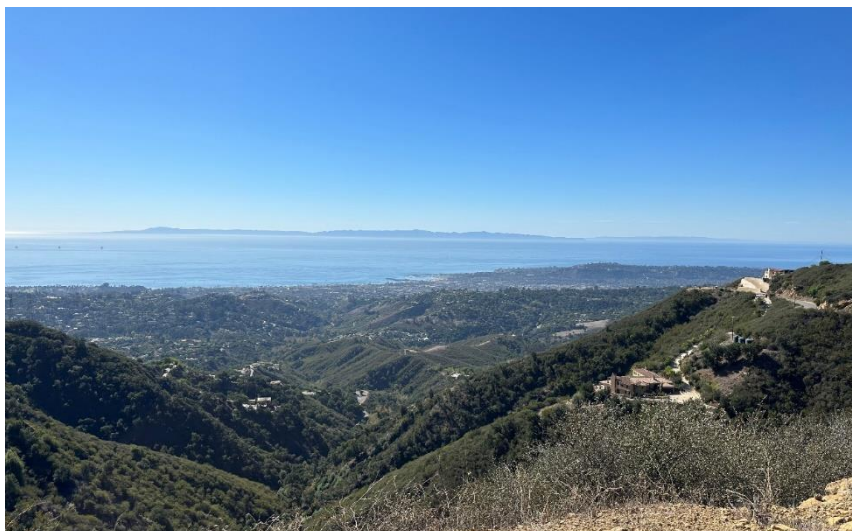
Abbildung 4: Hot Springs Trail Santa Barbara