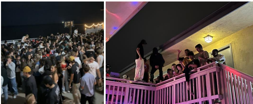
Abbildung 5: Hausparties auf dem Del Playa Drive