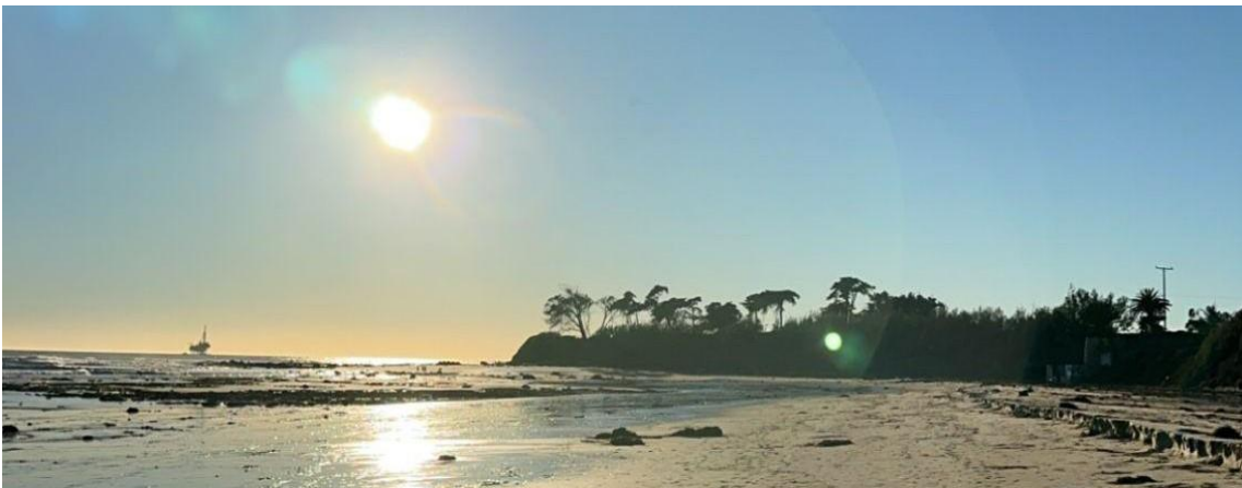
Abbildung 1: Sonnenuntergang in Isla Vista